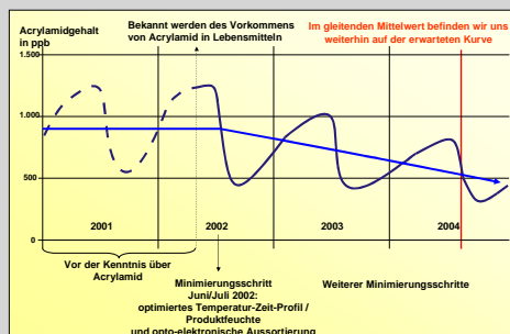
Abbildung 2: Minimierung von Acrylamid in Kartoffelchips – Hypothetische Trendlinie

Abbildung 1 zeigt zusammengefasst die Wirkung der von der deutschen Industrie seit April 2002 durchgeführten Optimierungsmaßnahmen bei der Kartoffelchips-Herstellung hinsichtlich der Acrylamid-Bildung. Dargestellt sind jeweils die Wochenmittelwerte. Deutlich erkennbar sind die ab Mai/Juni 2002 durchgeführten beschriebenen technologischen Maßnahmen in einer stark absinkenden Kurve in den ersten 4 betrachteten Monaten. Überlagert wird dieser Effekt von den saisonalen, erntebedingten Gegebenheiten. D. h. dass gegen Ende der Lagerperiode wieder ansteigende Acrylamid-Gehalte zu verzeichnen sind, die mit Beginn der Verwendung neuerer Kartoffeln wieder deutlich sinken.